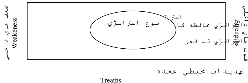
شکل ۱. انتخاب نوع استراتژی